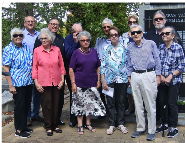
Kapu svētki 1. Maijā.